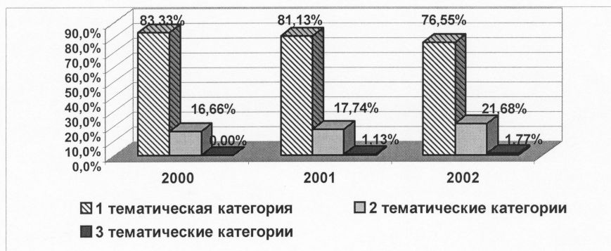
Рис.3. Статистика по количеству присваиваемых на одну публикацию тематических категорий в 2000–2002 гг.

На рис.3 показана статистика службы ИНИС в ОИЯИ за 2000–2002 гг. по количеству присваиваемых на одну публикацию тематических категорий, по которой можно судить об информационной насыщенности публикаций ОИЯИ по тематике ИНИС. В общей сложности за период 2000–2002 г. 80,3\% документов, обработанных центром ИНИС в ОИЯИ, была присвоена одна тематическая категория, 18,7\% документов – две тематические категории, а 1\% документов – три тематические категории.