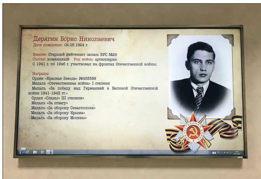
На информационных стендах во всех зданиях ЛНФ идет трансляция списка сотрудников лаборатории – участников Великой отечественной войны.

Сейчас реактор ИБР-2 работает в режиме временного останова, очередной цикл работы на мощности был завершён 30 марта 2020 года, после чего было принято решение об отмене плановых циклов работы в апреле и мае текущего года. При этом мы перенесли начало планово-профилактического ремонта на май, и уже 18 мая совместно с АО «ТЕН-