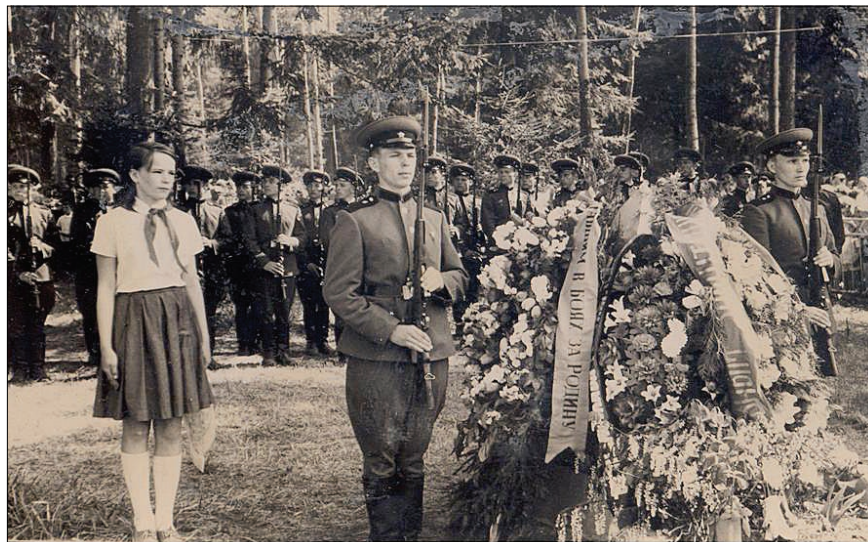
Братские могилы на Большой Волге митинг. 8 мая 1967 года

Юбилейный номер газеты хранит десятки имен сотрудников Института, чьи фронтовые биографии и напряженный труд на оборонных предприятиях продолжались в дубненских исследовательских лабораториях и производственных цехах, – от слесаря Лаборатории ядерных