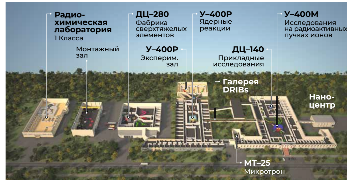
БАЗОВАЯ УСТАНОВКА — DRIBS-III УСКОРИТЕЛЬНЫЙ КОМПЛЕКС

В ноябре 2021 года Юрий ОГАНЕСЯН , научный руководитель ЛЯР ОИЯИ, в честь которого назван новый элемент 118 за его выдающийся вклад в исследование трансактиноидных элементов, был удостоен премии ЮНЕСКО–России им. Д. И. Менделеева в области фундаментальных наук «в знак признания его прорывных открытий, дополняющих Периодическую таблицу, и за его популяризацию фундаментальных наук в целях развития в глобальном масштабе».